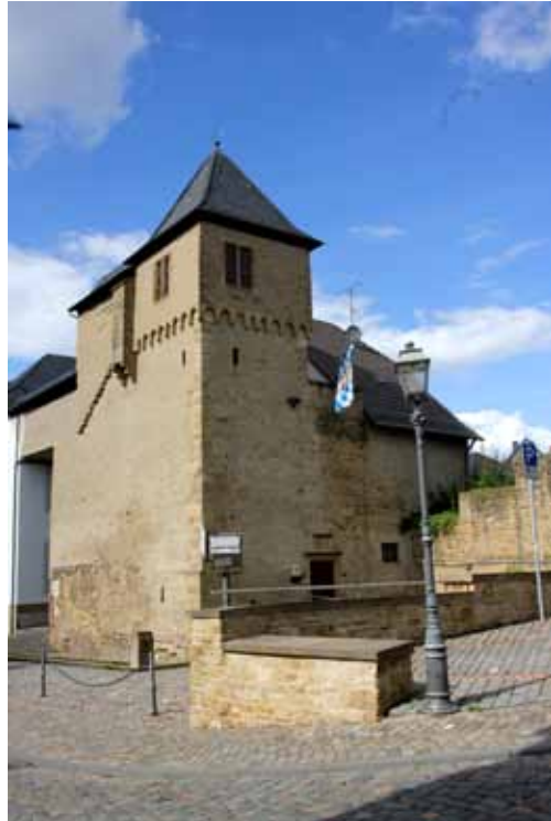
Lauterecken, sog. Veldenz-Turm, der Rest des ehemaligen Alten Schlosses.

Zum Oberamt gehören im engeren Umkreis von Lauterecken nur Wiesweiler am Glan und Lohnweiler und Heinzenhausen an der Lauter gelegen, die Orte östlich des Remigiusberges, von Haschbach am Remigiusberg (Landkreis Kusel) bis Schwanden,