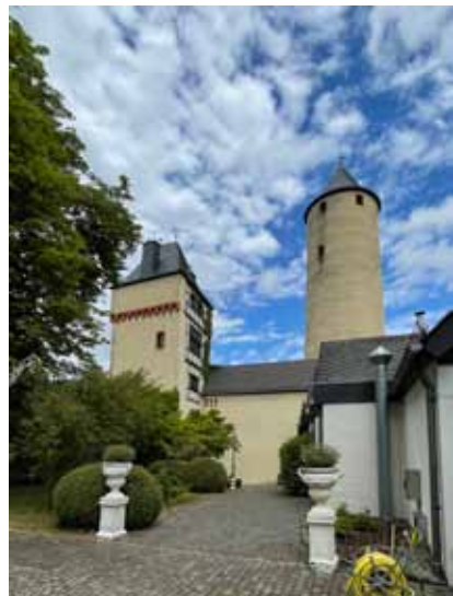
Stromberg, Neues Schloss Stromberg auf dem Schlossberg. Torturm (links und Bergfried).

Auch das Oberamt Stromberg ist ein eher kleines Oberamt, größten theils im Nahgau und [...] durchweg mit anderen Orten vermischt . 667 Die Burg samt der zu ihr gehörenden Dörfer kam wohl aus dem Besitz der Salier mit Pfalzgraf Konrad von Staufen 1156 an die Pfalzgrafschaft, die Orte blieben im Kern als Zubehör der Burg definiert. Das dürfte zum Teil die Gemengelage mit Orten des Oberamts Kreuznach erklären. Die alte, wohl salierzeitliche Burg Stromberg („Pfarrköpfe“) wurde Ende des 12. Jahrhunderts aufgelassen und durch die über der 1255 erstmals als Herrschaftsmittelpunkt bezeichnete Burg Stromberg ersetzt. Zu Beginn des 15. Jahrhunderts hatte Friedrich von Schonenburg, ritter, das cleyne burgelin halb zu Stromberg under myns herren, des hertzogen burg daselbs sowie daz gut