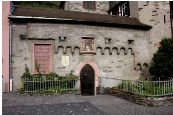
Kaub, kurpfälzisches Amtshaus, Rheinseitiger Zugang. Über dem Tor das kurfürstliche Wappen, datiert 1484, links an der Wand eine gereimte Gedenkinschrift zur Belagerung durch den Landgrafen von Hessen 1504.

Über den oben bereits für das Ende des 14. Jahrhunderts benannten Bereich hinaus gehörte im 18. Jahrhundert auch das kleine Gericht Holzfelden zum Oberamt, in dem insgesamt 14 Ortschaften und Höfe mit insgesamt 4760 Einwohnern gezählt wurden.