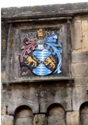
Freinsheim, kurpfälzisches Wappen am Eisentor (Feldseite).

An der räumlichen Erstreckung des Alzeyer Oberamts ist auffällig, dass Gau-Weinheim, Wolfsheim, Aspisheim, Sponsheim und Münster, die im Osten und Westen Orten des Oberamts Stromberg benachbart liegen, dem Oberamt Alzey unterstehen. Damit hat dieses offenbar die Straßenverbindung zum Rhein in Richtung Bacharach unter seiner Kontrolle.