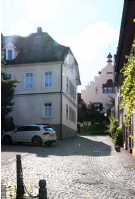
Mosbach, Kurpfälzisches Amtshaus, sog. Neues Schloss, im Kern 1410 begonnen, 1753 instandgesetzt.

Östlich des Oberamts Heidelberg liegen die Orte des Oberamts Mosbach, dessen Amtsbezirk aber das Heidelberger Oberamt im Norden und Süden gewissermaßen umfasst. Neckarabwärts der Oberamtsstadt reicht er über Eberbach bis Pleutersbach und Igelsbach, im Kraichgau gehört die Kellerei Hilsbach mit Sinsheim und Elsenz dazu. Im Elztal aufwärts gehört Oberschefflenz noch zum Oberamtsbezirk. Das Oberamt selbst hatte Untergliederungen in den Kellereien Neckarelz, Lohrbach, Eberbach (Zent und Kellerei) und Hilsbach sowie in der Amtsvogtei Zwingenberg. Dem Oberamt direkt unterstellt waren nur die Dörfer Ober- und Untergimpfern und Siegelsbach. 647 Im Oberamt wurden 1785 21326 Einwohner in 3 Städten, 46 Flecken und Dörfern sowie 14 besonderen Weilern und Meyerhöfen gezählt.